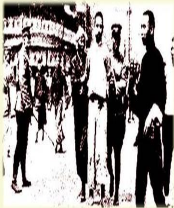
蒋介石四·一二反革命政变。图为国民党反对派捕杀共产党员和人民群众的情形。